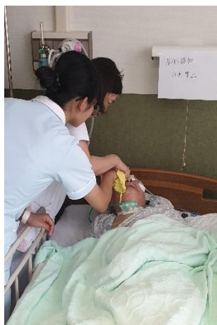
協助長輩清潔與舒適-刮鬍子及清潔臉部