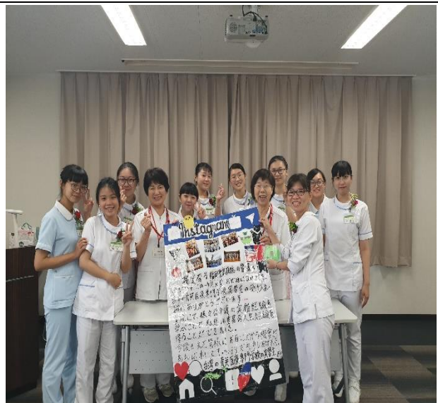
休業式-感謝副院長及護理部主任