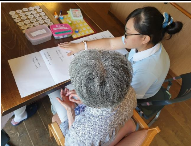
長輩教唱日文歌曲