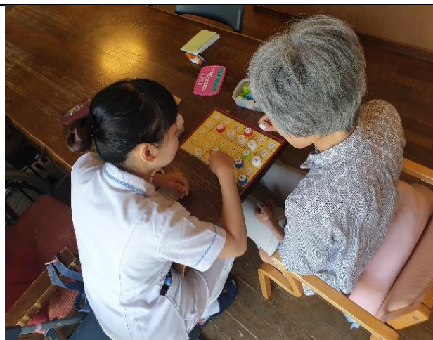
協助長輩數字認知