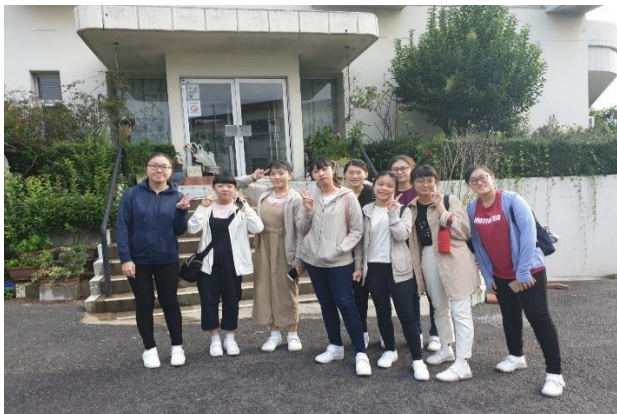
宿舍前準備出發實習去