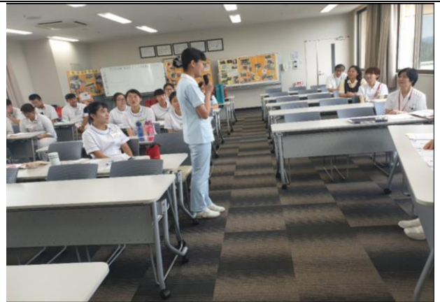
福岡聖惠醫院會議室報到並自我介紹