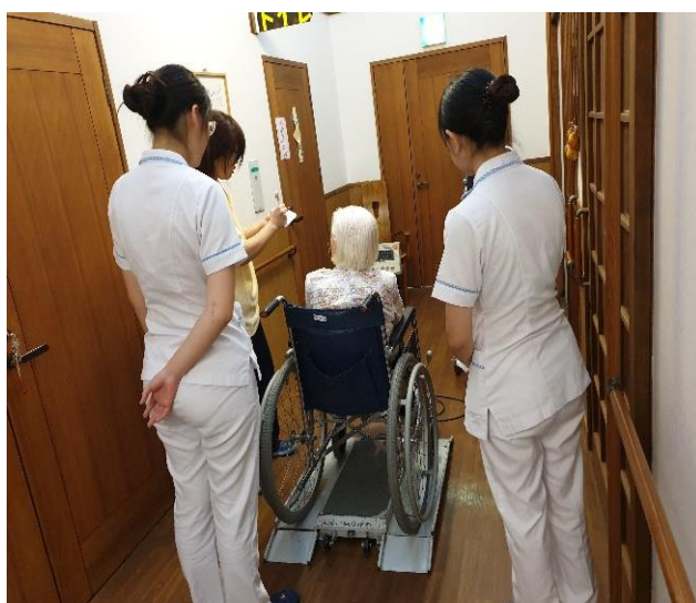
輪椅式體重機協助長輩量體重