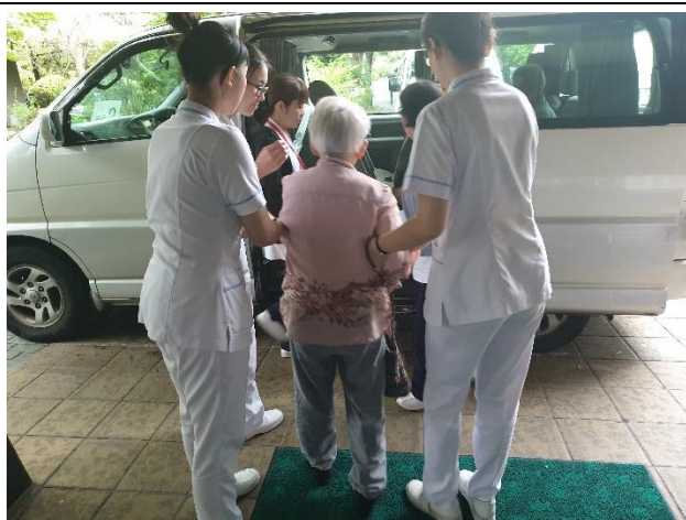
日照中心協助長輩坐車返家