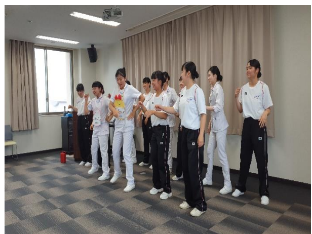
與日本高校生交流-唱跳~你是我的花朵