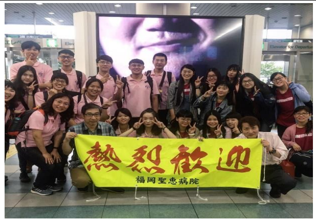
聖惠醫院師長機場接機