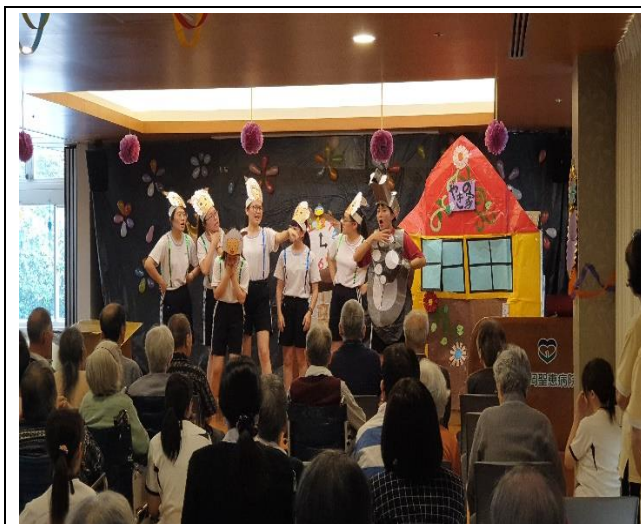
成果發表-日文話劇~大野狼與七隻小羊