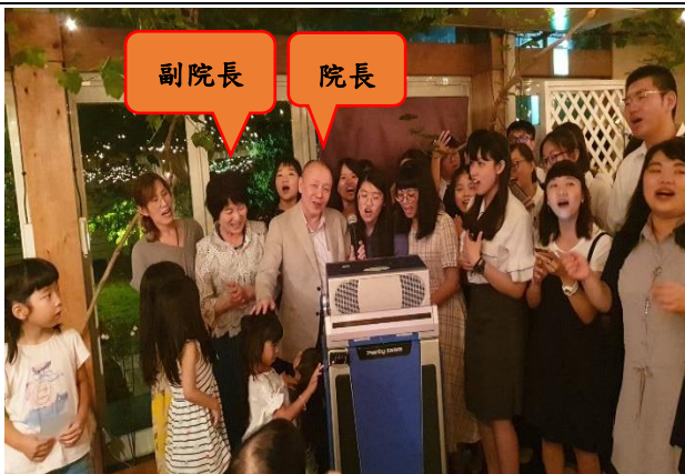
納涼會與院長、副院長合唱日文版"我只在乎你"