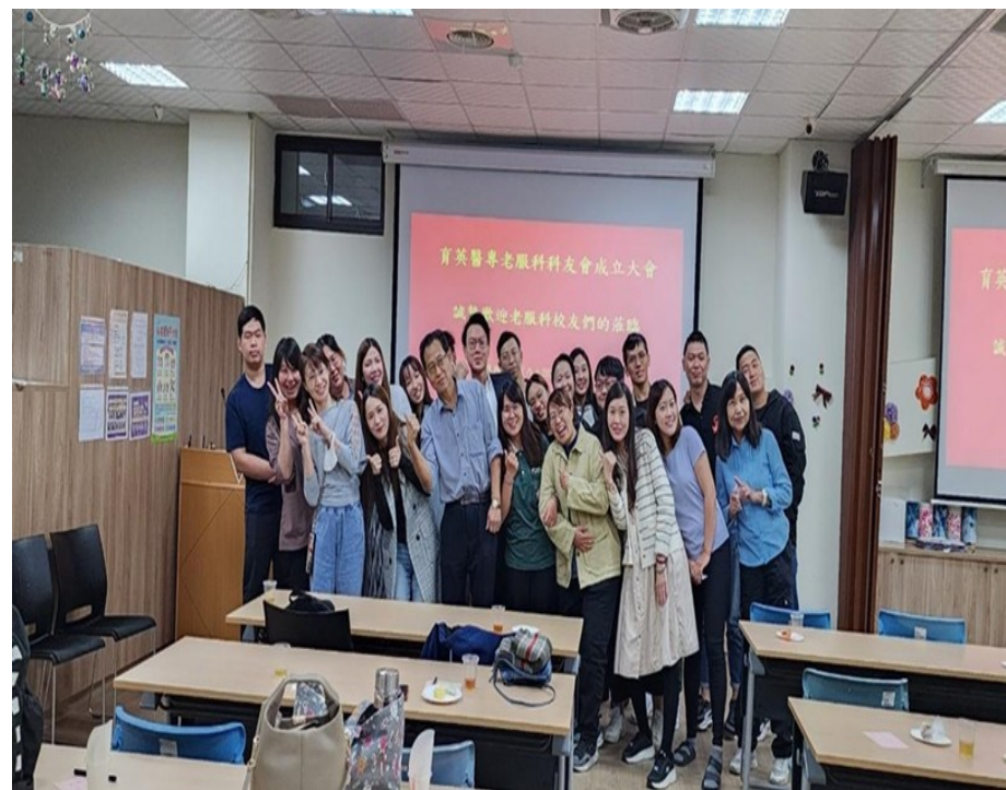
老服科科友會成立(112/11/17)