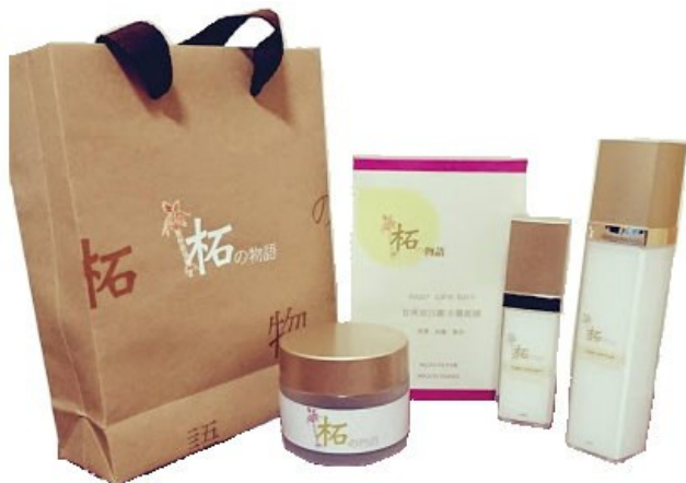
甘蔗皮囊泡美容系列商品