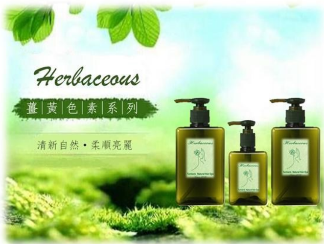
薑黃色素染髮系列商品