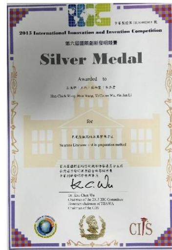
微脂粒國際發明展銀牌