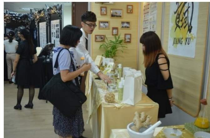
學生商品開發成果展現 12